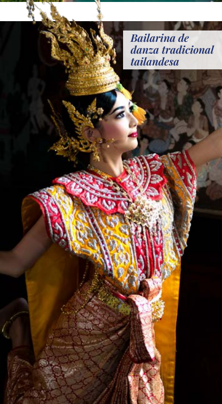
Bailarina de danza tradicional tailandesa