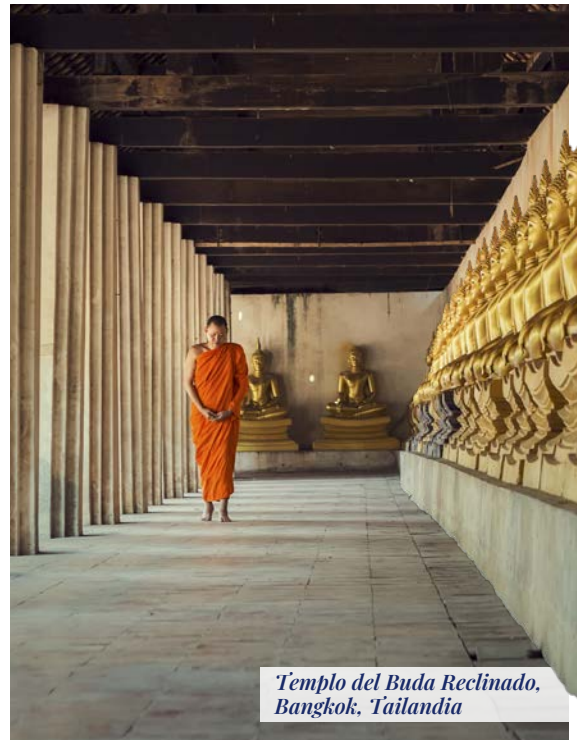
Templo del Buda Reclinado, Bangkok, Tailandia