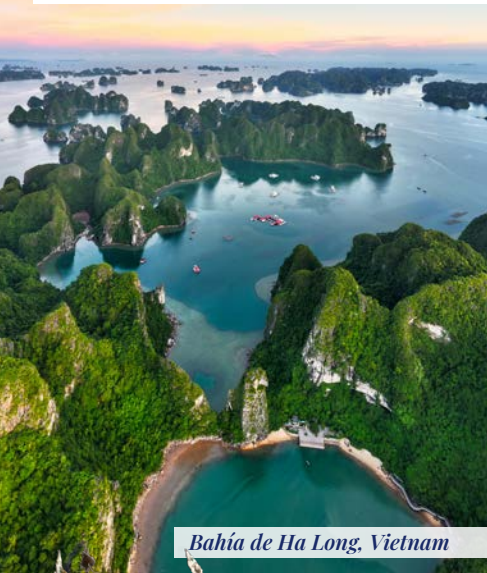
Bahía de Ha Long, Vietnam