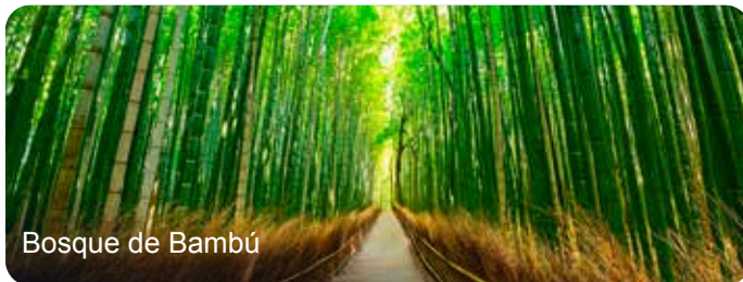
Bosque de Bambú

Llegada a Osaka primera hora de la tarde. Asistencia en el aeropuerto y traslado a Kioto. Tarde libre. Alojamiento en Hotel 4*.