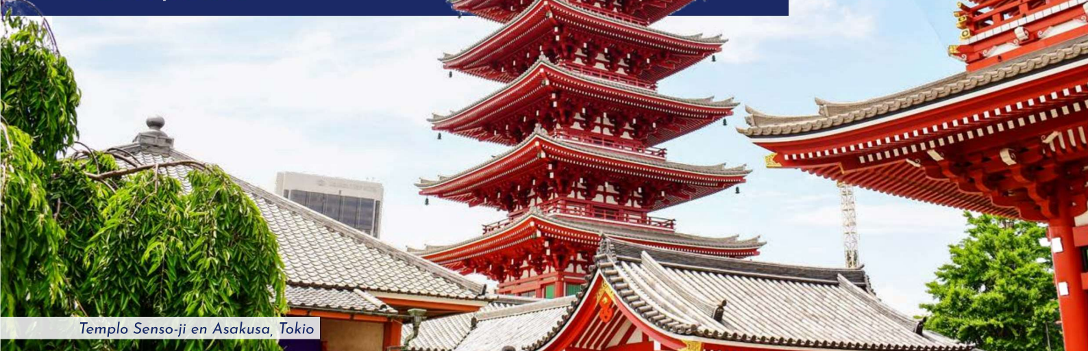
Templo Senso-ji en Asakusa, Tokio