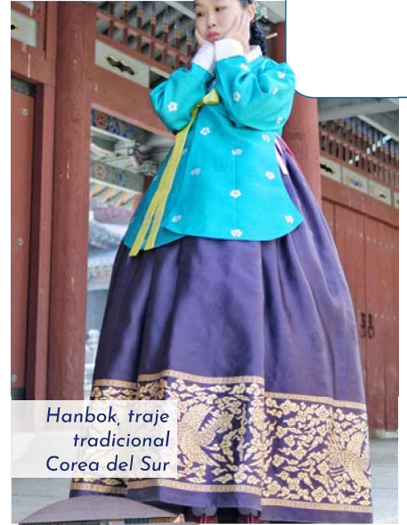
Hanbok, traje tradicional Corea del Sur