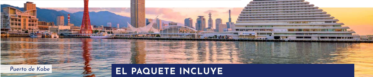
Puerto de Kobe