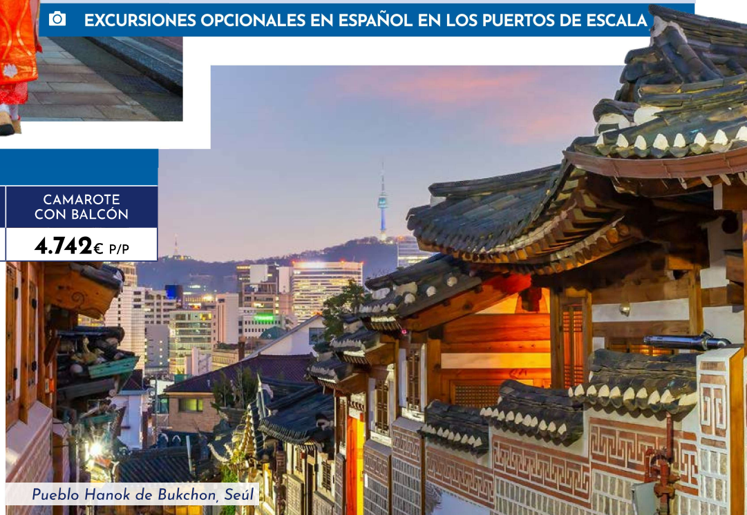
Pueblo Hanok de Bukchon, Seúl

*Consultar suplemento en Suite, vuelos en Business, seguro y gastos de cancelación.