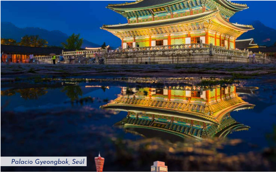
Palacio Gyeongbok, Seúl