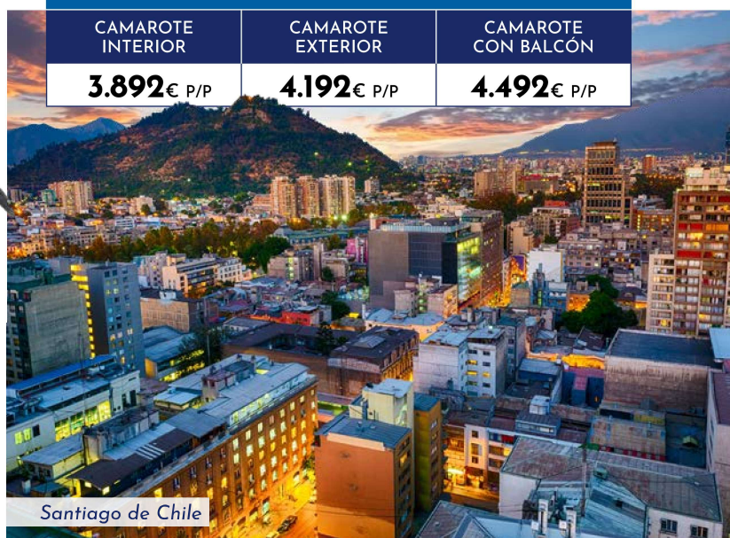
Santiago de Chile

Salida sujeta a un mínimo de 20 personas. Información y reservas en tu Agencia de Viajes. El paquete no incluye: bebidas en almuerzos o cenas, excursiones en los puertos de escala del crucero, propinas a bordo del crucero, maleteros y guías, seguro de asistencia en viaje y gastos de cancelación, visados o cualquier otro servicio no especificado.