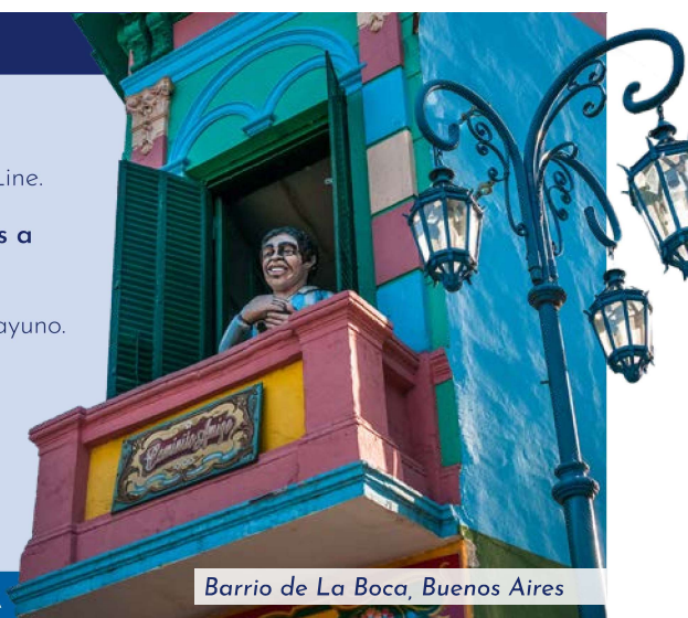
Barrio de La Boca, Buenos Aires