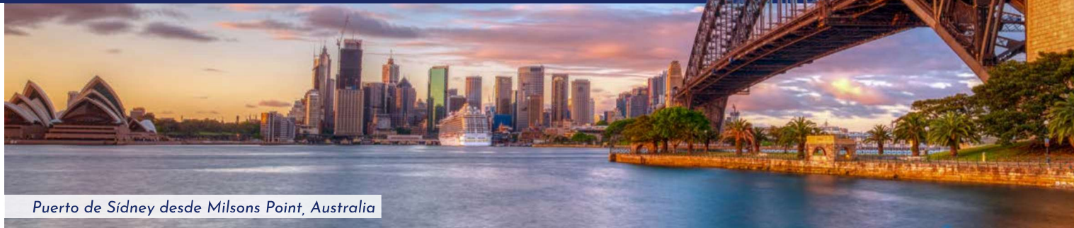
Puerto de Sidney desde Milsons Point, Australia