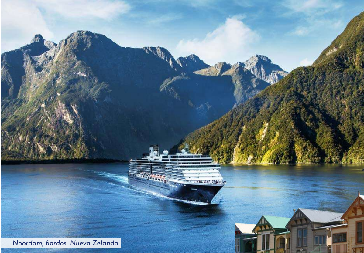
Noordam, fiordos, Nueva Zelanda