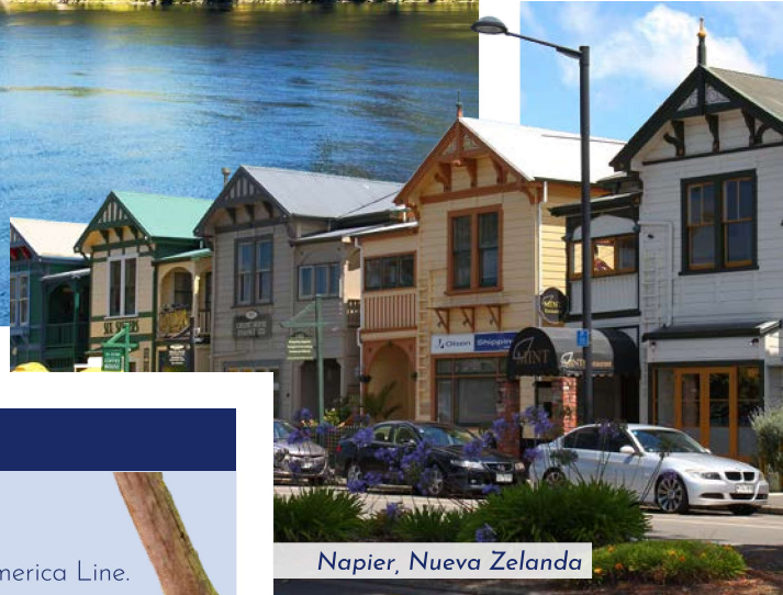
Napier, Nueva Zelanda