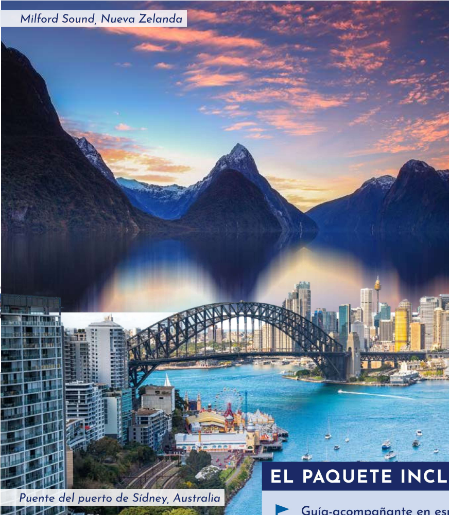
Milford Sound, Nueva Zelanda