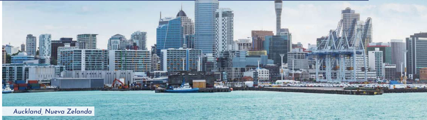
Auckland, Nueva Zelanda