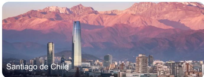
Santiago de Chile

Salida del vuelo nocturno de desde Madrid con destino Santiago de Chile. Noche a bordo. Conexiones desde Barcelona y Lisboa.*