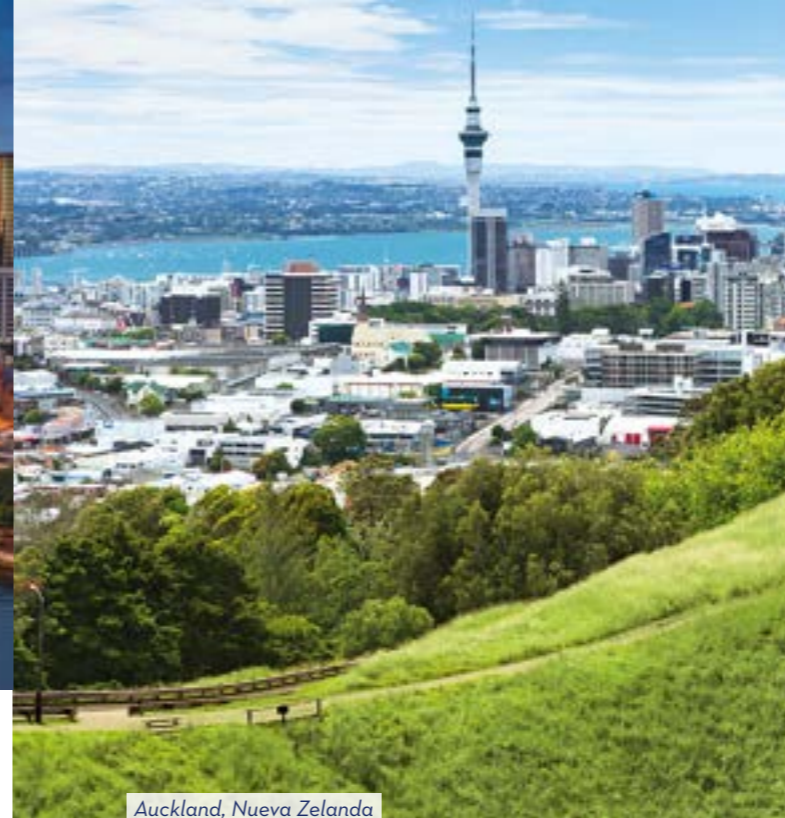
Auckland, Nueva Zelanda