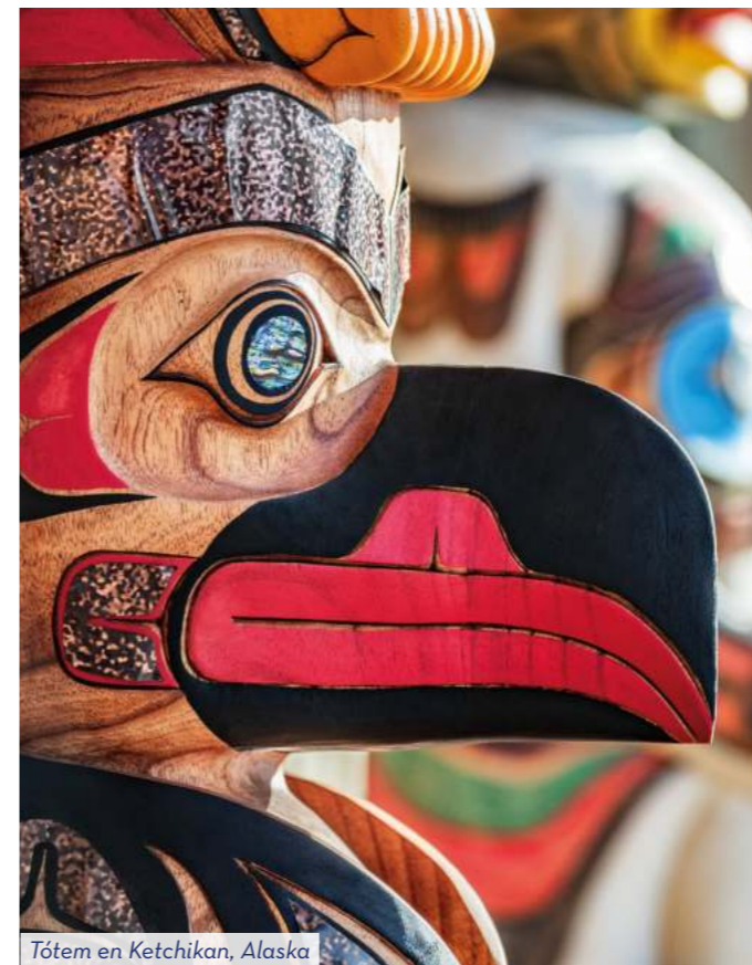
Tótem en Ketchikan, Alaska