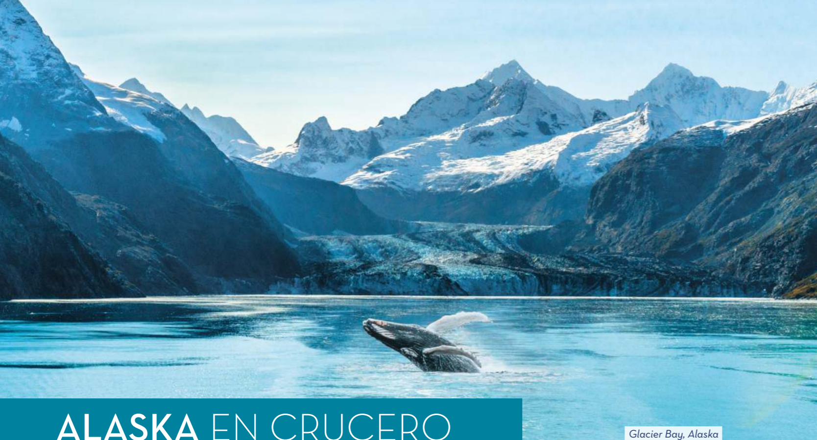
Glacier Bay, Alaska