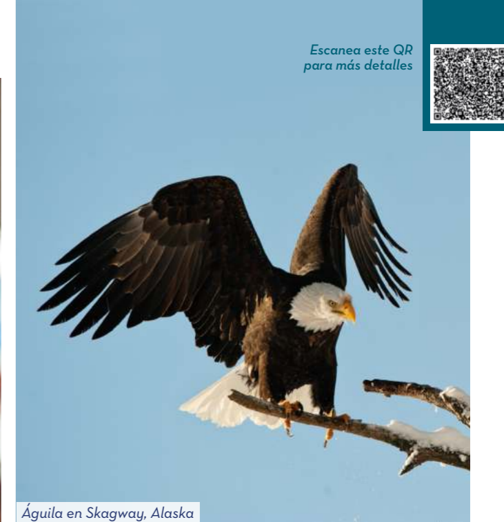
Águila en Skagway, Alaska