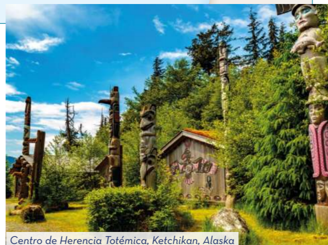
Centro de Herencia Totémica, Ketchikan, Alaska