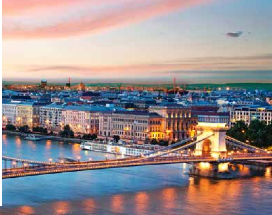
Puente de las cadenas. Budapest.