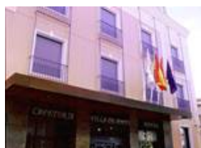
Mc Villa De Pinto 9354