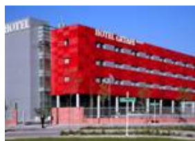
Ramada By Wyndham Madrid Getafe 9355