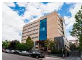
Mc Las Provincias 9354