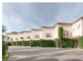
Tryp Madrid Getafe Los Angeles Hotel 9355