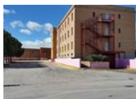
Hotel Humanes 9354