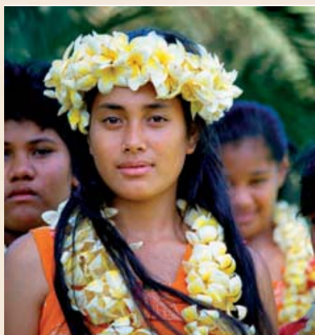
Pago Pago, Samoa